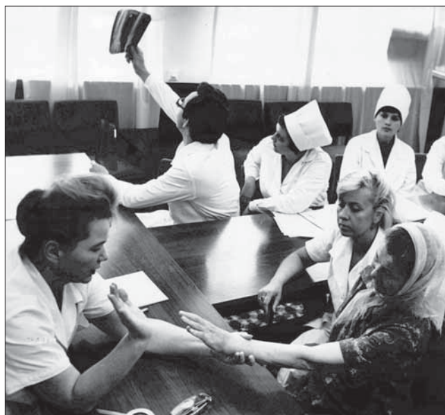
Фото 3. Заседание комиссии реабилитации Photo 3. Rehabilitation commission meeting

Накопленный опыт отразился в диссертации О.Н. Щепетовой «Принципы организации системы промышленной реабилитации больных и инвалидов на предприятии машиностроения» (1981 г.), докладе на совещании комитета экспертов ВОЗ по предупреждению инвалидности и реабилитации (1983 г.), а также в совместной монографии