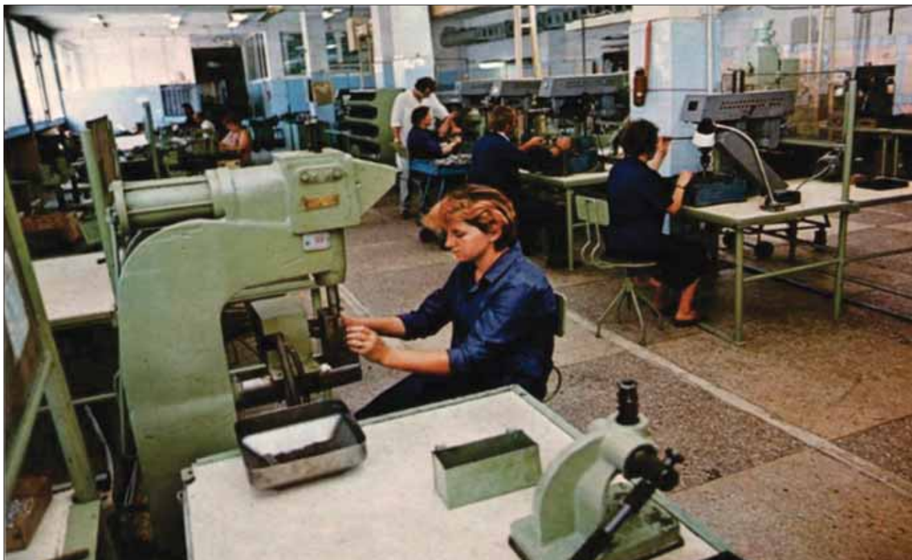
Фото 2. Цех промышленной реабилитации Photo 2. Industrial rehabilitation workshop

5. Изготовление в процессе реабилитации товарной продукции – деталей автомобиля.