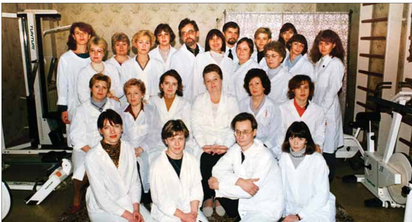
Фото 4. Коллектив отделения реабилитации (1994 г.)

Для каждого больного составляется индивидуальная программа реабилитации с учетом характера и тяжести патологии, срока, прошедшего после травмы или начала заболевания, особенностей клинической картины, выявленных психологических и функциональных нарушений, наличия сопутствующей патологии. В основу составления программ медицинской реабилитации положен принцип широкого использования средств и методов аппаратной физио-, рефлексотерапии, водолечения, кинезотерапии, психотерапии. Наличие стабильного работоспособного коллектива, поддержка администрации института определяет уверенность отделения реабилитации в завтрашнем дне: реализации