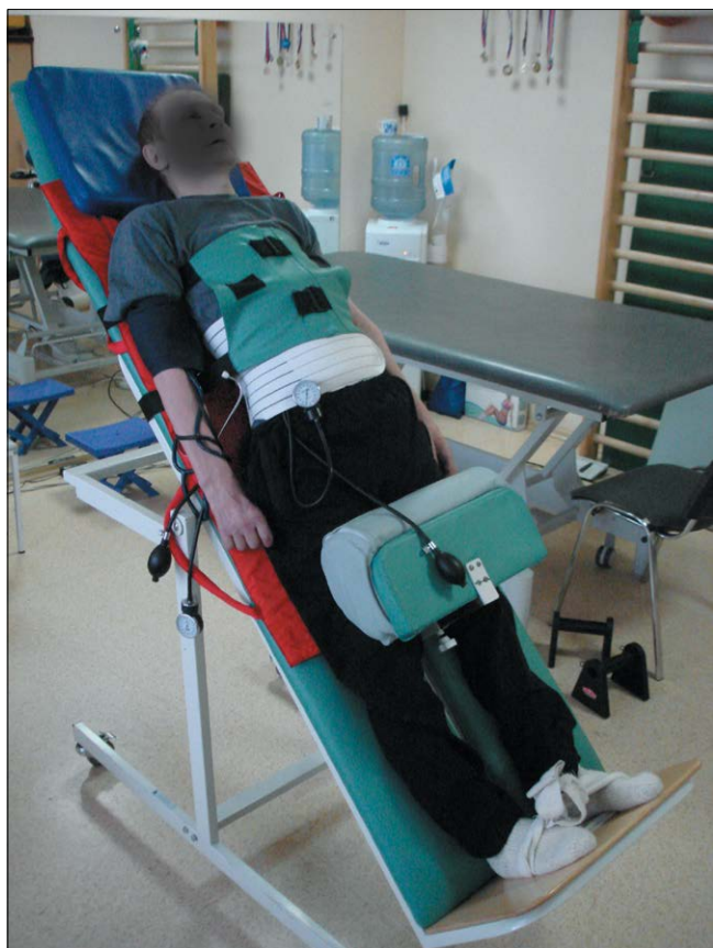
Рис. 1. Пассивная ортостатическая проба в БПБС без диагностического оборудования